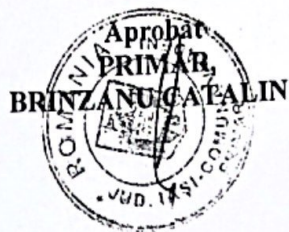
TABEL PROGRAMAREA CONCEDIILOR DE ODIHNA PENTRU FUNCTIONARIII PUBLICI PE ANUL 2022